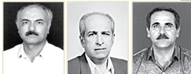
عطاء... مدنی سید موسی تابعی تقی شاهی